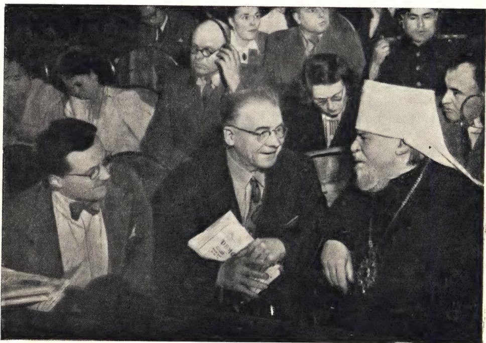
Митрополит Николай на Парижском Конгрессе беседует с Председателем Американского Всеславянского комитета г. Лео Крайциком